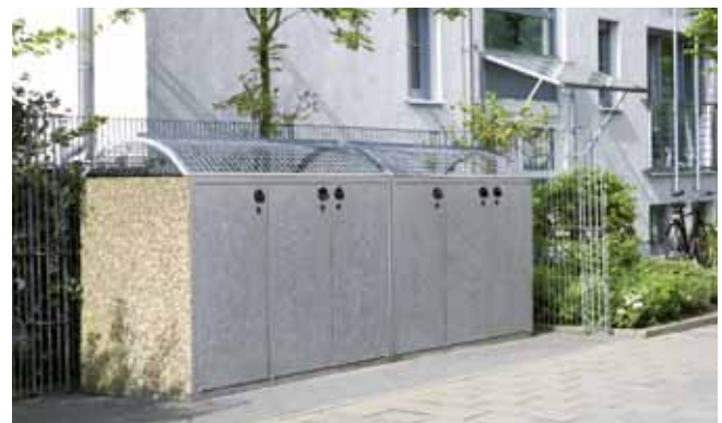
Modell: 1203 Dreifachschränk, Stein: Waschbeton; Stahl: stückfeuerverzinkt