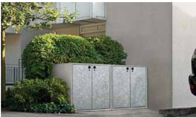
Modell: 1202 Zweifachschränk, Stein: Sichtbeton; Stahl: stückfeuerverzinkt