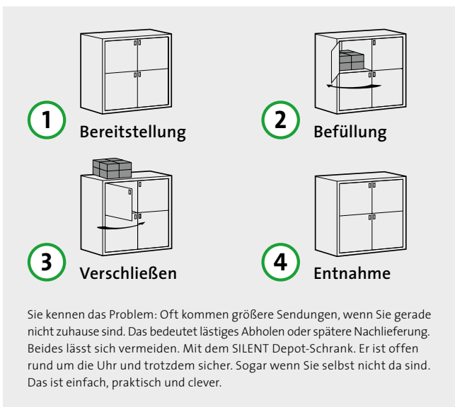
← Modell: SILENT 242, Stein: Sichtbeton; Stahl: Anthrazitgrau

Die SILENT LINIE lässt keinen Wunsch offen, den ein Steinschrank-System von heute erfüllen soll. Das einzigartige Tür- und Schließkonzept garantiert eine wohltuende Geräuschreduktion beim Befüllen und Entleeren. Ideal als Stellplatz für Abfallbehälter, der auch im Sommer kühl bleibt und so lästige Gerüche verhindert. Das ist hygienisch und schützt vor Ungeziefer. Im Winter und bei Sturm sind die Abfallbehälter sicher geschützt und können jederzeit bequem befüllt werden.