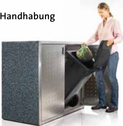
Modell: SILENT 122, Stein: Perlmutter schwarz; Stahl: Edelstahl ← Modell: SILENT 122, Stein: Sichtbeton; Stahl: Anthrazitgrau