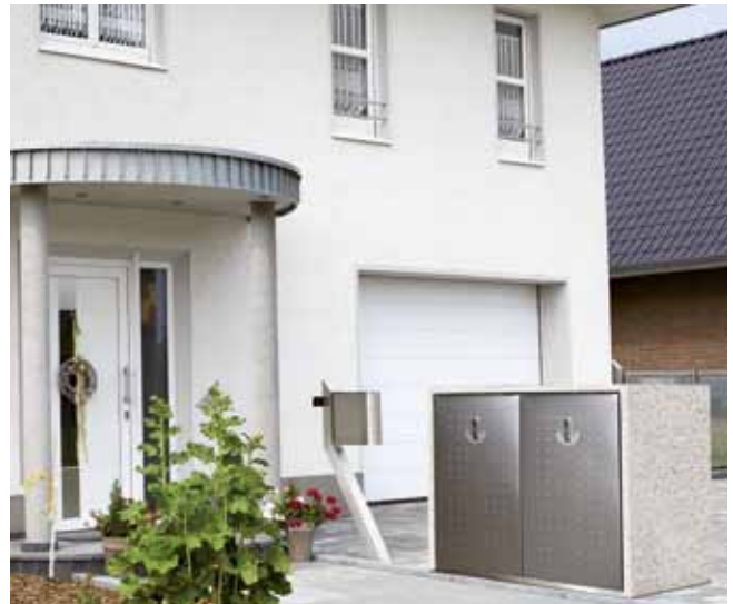
Modell: 24.1 DUO, Stein: Redomit pepita, von Hand gestockt; Stahl: Edelstahl