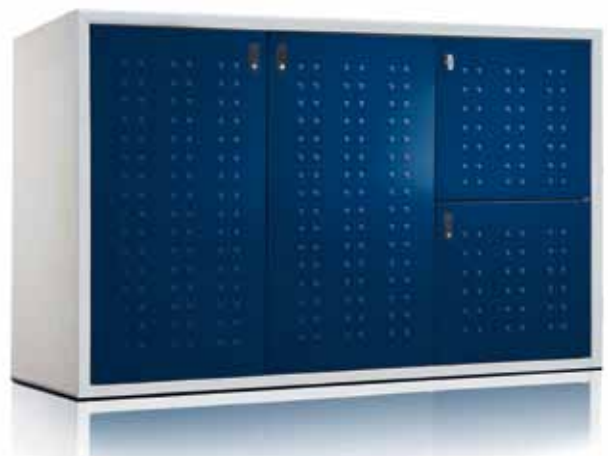
Modell: SILENT 243 Depot, Stein: Sichtbeton; Stahl: Stahlblau