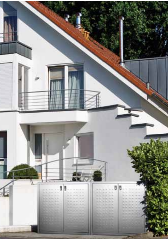
Modell: SILENT 242, Stein: Eisgrau; Stahl: Edelstahl

Die anspruchsvollen Produkte der SILENT LINIE bieten echten Mehrwert