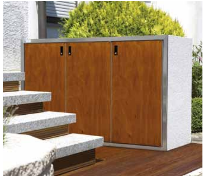
Modell: SILENT 123, Stein: Eisgrau; Holz: Walnuss

Die SILENT LINIE lässt keinen Wunsch offen, den ein Steinschrank-System von heute erfüllen soll. Das einzigartige Tür- und Schließkonzept garantiert eine wohltuende Geräuschreduktion beim Befüllen und Entleeren. Ideal als Stellplatz für Abfallbehälter, der auch im Sommer kühl bleibt und so lästige Gerüche verhindert. Das ist hygienisch und schützt vor Ungeziefer. Im Winter und bei Sturm sind die Abfallbehälter sicher geschützt und können jederzeit bequem befüllt werden.