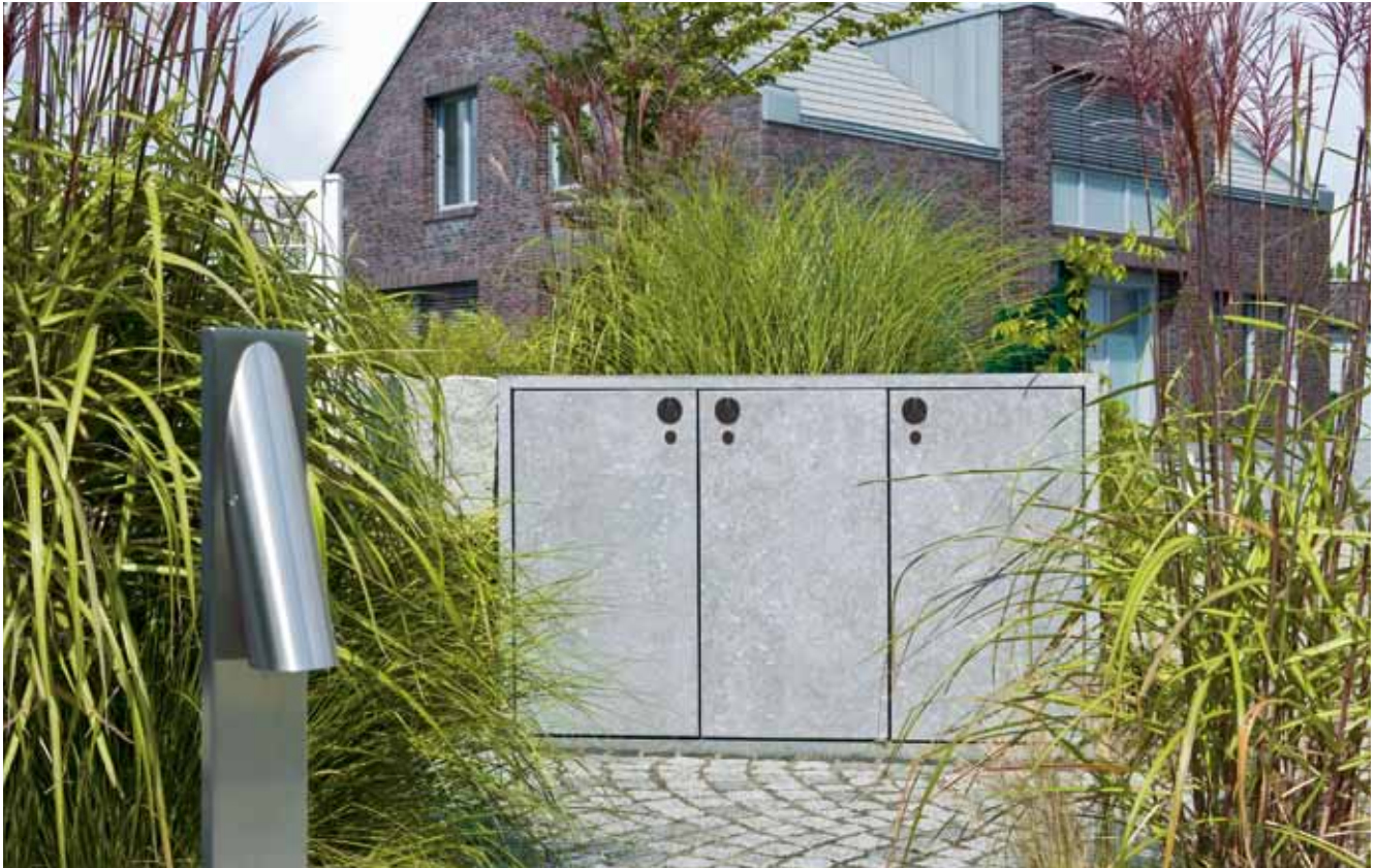
Modell: 1203 Dreifachschränk, Stein: Sichtbeton; Stahl: stückfeuerverzinkt