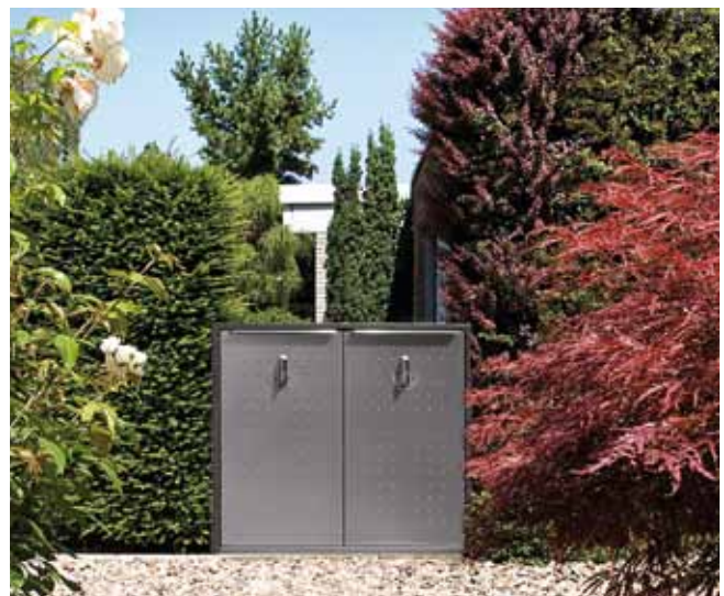
Modell: 24.1 DUO, Stein: Anthrazit, von Hand gestockt; Stahl: Edelstahl → Modell: 24.1 DUO, Stein: Anthrazit, von Hand gestockt; Stahl: Edelstahl