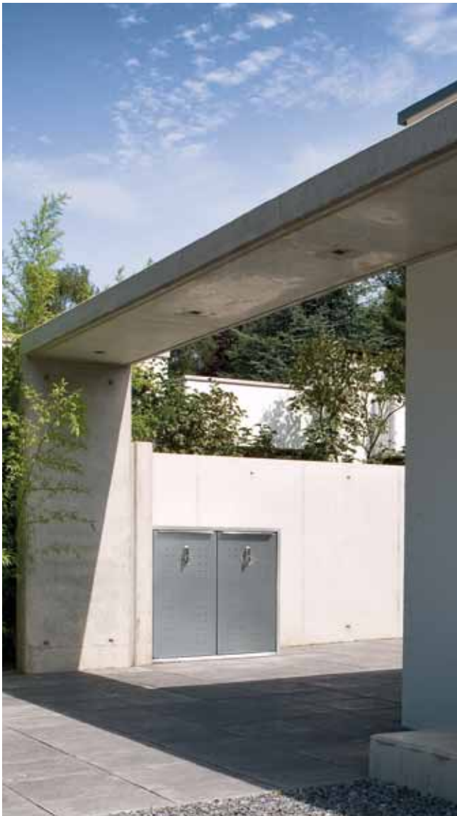
Modell: 24.1 DUO, Stein: Procarat mixed, von Hand gestockt; Stahl: Edelstahl

Darüber hinaus überzeugt die AVANTGARDE LINIE auch in der Optik. Zur Auswahl stehen vier verschiedene Stein-Außenflächen sowie sechs Stahl-Außenflächen inklusive Edelstahl. Die hochwertigen Materialien schaffen die Harmonie mit zeitgemäßer Architektur und sorgen für eine Lebensdauer, für die der Name PAUL WOLFF aus Tradition steht.